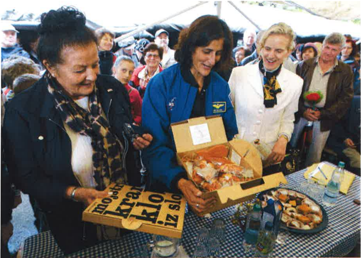
Drago gostjo so domačini razveselili s kranjsko klobaso.