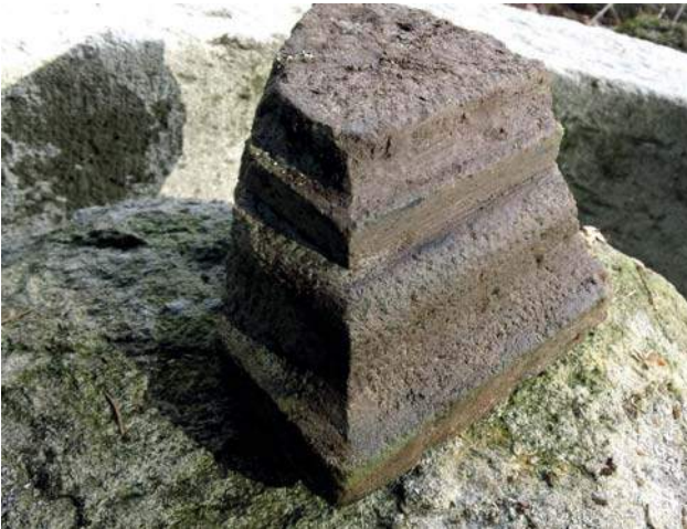
Deli vratnega portala

Pokljuka 9 (oba loči tesen, imenovana Poključka soteska), naj bi po ustnem izročilu zakrivil graščak, ki je tja poslal svoje nezakonske sinove, ki so kot sad prepovedane ljubezni obljudili in izkrčili nerodovitno divjino blejskega gospostva, je možno umestiti v pripovedko za zimsko paberkovanje 10 ali pa s kritično presojo dostopnih in še ne raziskanih podatkov v zgodovinski okvir z izhodiščnim dejstvom.