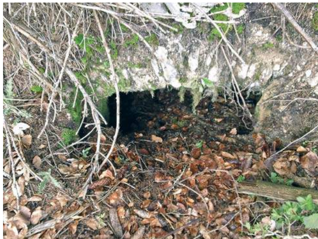
Klet pri Pustu