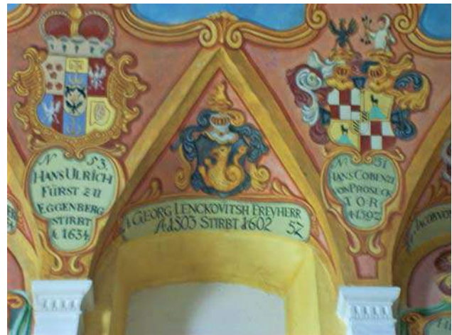
Napisi z imeni deželnih glavarjev v cerkvi