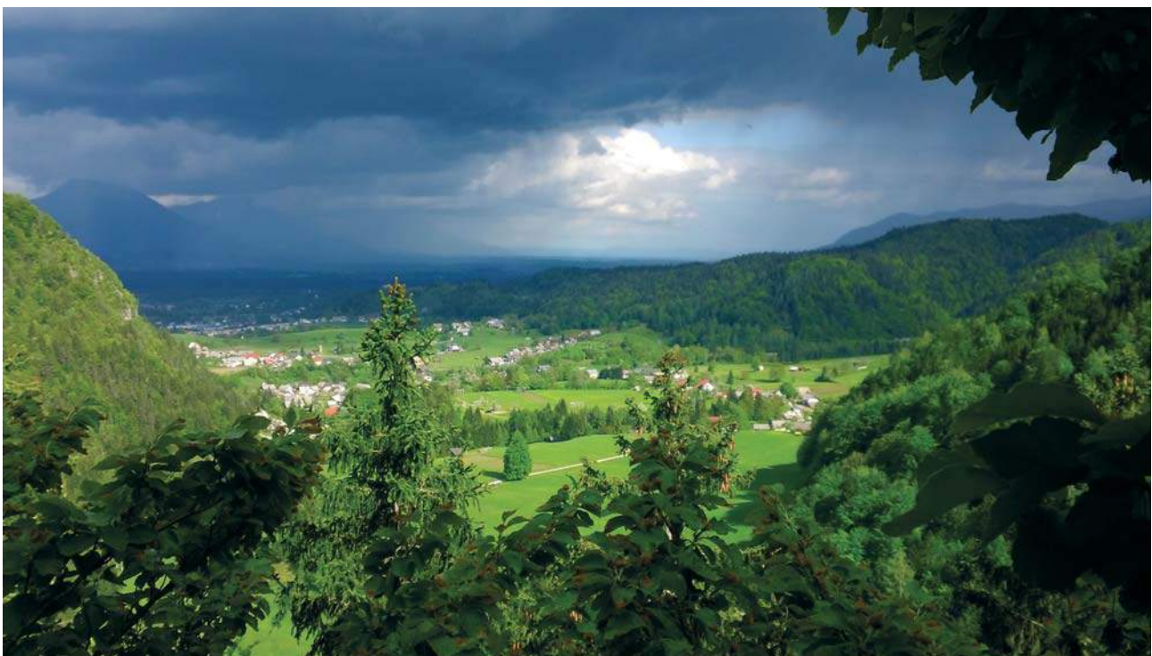
Pogled pred nevihto Z Vrha

izvora krajevnih, ledinskih in hišnih imen, katastrof, pripetljajev in peripetij. Spomina, ki nemalokrat v odvisnosti od dolžine časovne premice in glede na ustno prenašanje doživlja v veriženju interpretacij in nastanka vrzeli transformiran prehod iz preteklosti v mit in mistifikacijo. Kaj rado se zgodi, da pisni