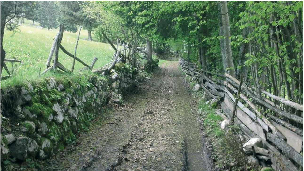
Ulice k Poklukarju