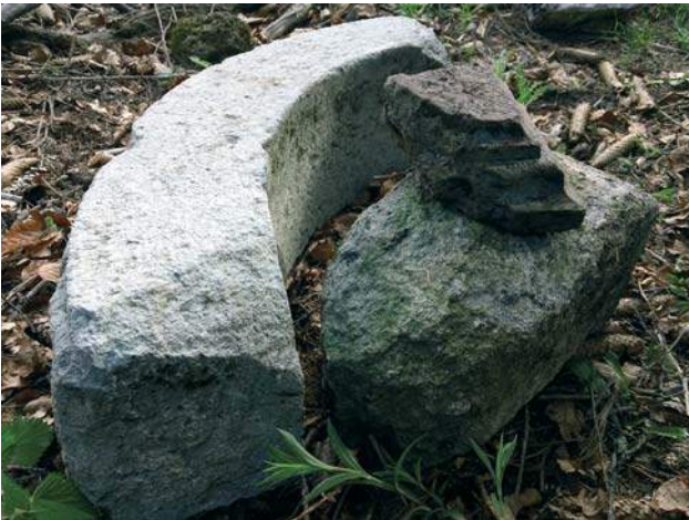
Bogato profilirani sims okenskega okvira in deli vratnega portala