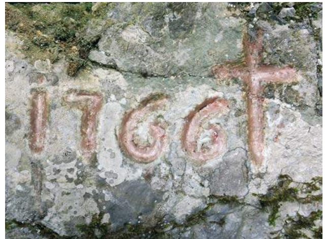
Pod Vrhom v skalo vklesana letnica

V zapisu so rodoslovne vrzeli in nejasnosti,