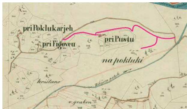
Arhiv RS, Reambulančni kataster za Kranjsko, k. o. Zgornje Gorje, SI AS 181/L/L179/g/C09 – izsek s približnim vrisom stare poti (rdeče barve)

Hišno ime Pri Pustu, kjer so se stoletja pisali Poklukar, ni neobičajno in se pogosto pojavlja v hribovitih predelih. 7 Misel napeljuje na izpeljavo na pustoto in krčevino, nastalo sredi gozda ter na njeno osamljenost in odročnost. Vendar, če izhajamo iz teze, da je