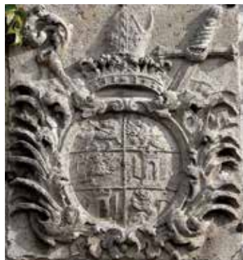
Johann VII. Franz von Khuen, kamniti grb, Blejski grad

Škof je bil znan po svoji dobroti in po tem, da je rad obiskoval briksenske posesti. Skoraj zagotovo je obiskal tudi Bled in blejski grad, potem ko ga je leta 1690 prizadel močan potres in je bil potreben temeljite obnove.