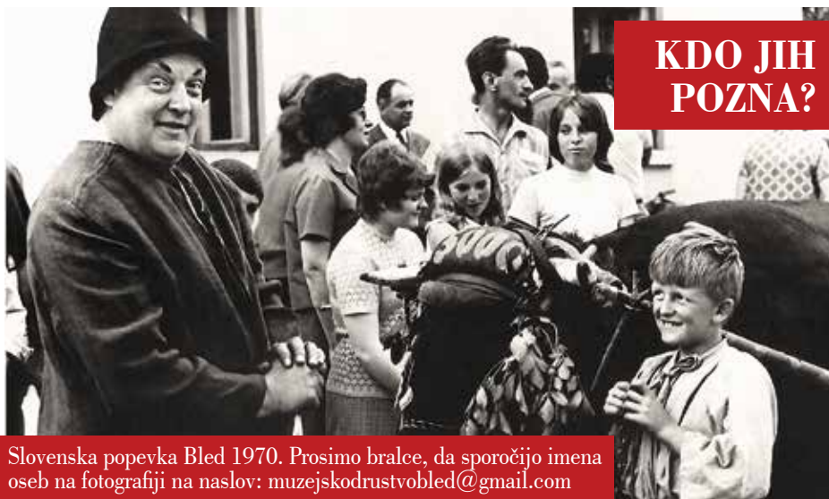
Slovenska popevka Bled 1970. Prosimo bralce, da sporočijo imena oseb na fotografiji na naslov: muzejskodrustvobled@gmail.com