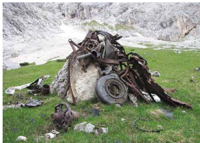
Ostanki razbitin Liberatorja pod Rjavino, leta 2011