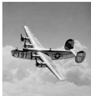
Bombnik B - 24, Liberator

čez čas odpravilo pod Rjavino k razbitinam letala. Tamkaj so v začasni skupni grob položili najdena trupla posadke. Po vojni so posmrtno ostanke nesrečnih letalcev prepeljali v ZDA. Leta po dogodku so nekateri okoličanov, ki so vedeli za kraj razbitin, hodili tja gor po aluminij. Z njim se je dalo zaslužiti, kakor napraviti katerega uporabnih izdelkov, zlasti priročnih koharjev. Potres leta 1998 in snežna zima 1999 sta s plazom v vznožje melišča nanesele devet Ameriških petkilogramskih minometnih min. Nevarni tovor so člani regijskega centra za zaščito pred nevarnimi ubojnimi sredstvi in pripadnika gorske enote policije, odnesli v dolino na strokovno uničenje. Nekaj zanesenjakov, ljubiteljev letalstva se je v sedemdesetih letih dvajsetega stoletja vsako leto podajalo tja gor. Ustanovili so celo klub Liberator. Tamkaj