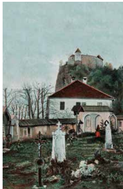
Blejsko pokopališče ob farni cerkvi s. Martina, 1904, (arhiv, Niko Mučič)

(Op. Mlino in Zazer spada v katastrsko občino Želeče.) Zadnje, peto znamenje, je bil leseni križ pri postajališču za izvočke – fijakerje. Tu je pričakal žalni sprevod župnik z dvema ministrantoma. Blagoslovil je krsto s pokojnim, nagoovoril pogrebce, pogrebni sprevod je pospremil v cerkev in na pokopališče za cerkvijo, kjer so umrle pokopavali do leta 1889, ko je bilo zgrajeno novo pokopališče na robu vasi Grad. Od omenjenih znamenj se je ohranil edino križ v Želečah, če odmislimo bivšo kapelico pri tunelu.