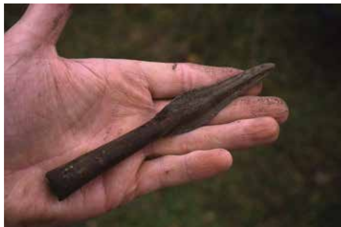
Bronasta sulična ost