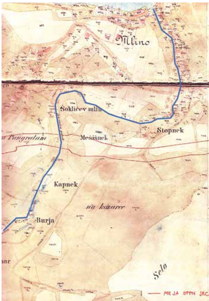
Zgodovinski arhiv Ljubljana, enota za Gorenjsko Kranj (izsek)

izročilu so tudi pri gradnji Suvobora naleteli na grobove.