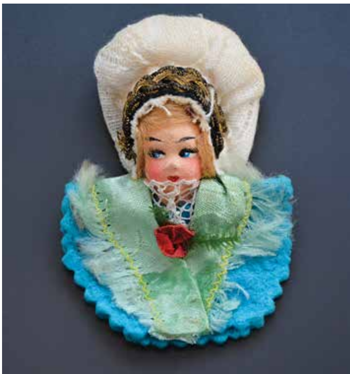
Izdelek Jule Mollnar, 50. ali 60. leta 20. stoletja, v 8 cm, š 5,5 cm, deb. 3 cm, hrani Gorenjski muzej, inv. št. E 8171.

navihano gleda nekam na desno, je verjetno serijski izdelek iz papir mašeja. Zlat čelnik na avbi je iz spletene zlate žice, spretno prišite na kos črnega traku, oglavje avbe je iz tankega bombaža, morda celo gaze (mestoma izvezene z ažur šivi), pravo obliko ima zaradi mehke podloge (vata?). Košček prave svilene rute je strojno cik-cak zarobljen. Prsi ji krasi trak, zguban kot nageljnov cvet in plastični zeleni vejici, vrat ji obdaja čipka. Izdelek bi lahko bil kičast, a ima odlično zgodbo. Povezuje dva izjemno vredna Gorenjca: Blejko Julio Mollnar (1891–1967) in Rutarjana Stanko Koširja (1917–2014), avtorja 16 knjig o domačem kraju Rute, uradno Gozd Martuljek, in rutarškem narečju. Punčko je Stanko leta 2006 Gorenjskemu muzeju podaril skupaj s svojimi izdelki, miniaturnimi orodja za predelavo lanu. Povedal je, da jo je kupil pred mnogimi leti na Bledu, da je izdelek Jule Mollnar. Bled mu je bil domač, saj se je tam pred drugo svetovno vojno učil za natakarja v hotelu Union, nekaj časa pa je delal tudi v hotelu Toplice. Stankove miniaturne so zdaj razstavljene v Liznjekovi hiši v Kranjski Gori, punčka pa je varno spravljen v Kranju.