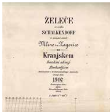
Mlino - stanje leta 1907

Na Blejskem otoku so pokopavali od sredine 9. do sredine 11. stoletja. Datacija temelji na pridatkih v grobovih. Domnevamo lahko, da so grobovi na otoški cerkvi povezani z Mlinom, ob dejstvu, da je bilo osrednje zgodnje srednjeveško pokopališče Blejskih vasi na Pristavi pod Blejskim gradom. Grobišče/a na Mlinem nas pripelje do sklepa, da je na tem ožjem