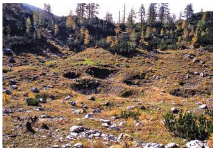
Blejska konta

Posebnost Blejske konte je njeno površje, prekopano z značilnimi površinskimi okroglimi rudnimi kotanjami, ki so ostale za antičnimi kopači in nabiralci železove rude. Bronasta sulična ost je bila skrita med obloženimi kamni in zgoraj zaščitena z varovalno kamnito ploščo. Položena je bila v smeri V-Z, kar kaže na daritveni namen. Hrani jo Inštitut za arheologijo ZRC SAZU.