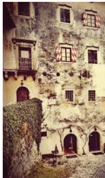
Tisočletno zidovje z odtisi usod ..., foto Marjan Zupan.tif

nil na katerega med ljudstvom ali obiskovalci zaznanih opažanj in čutenj gradu, ki mi jih je bilo dano slišati in občutiti na častitljivem objektu. Preskočil bom pisanim edicijam in splošnem vedenju poznano legendo o pogubljenem plemiču, užaloščeni vdovi in tragediji okoli potopljenega zvona. Ljudje so in smo v objemu tisočletnega zidovja občutili in zaznali marsikaj tega ... Obiskovalec iz Novega Mesta mi je zatrdil, da se nahaja pod tlakom grajske kapele votel prostor, o katerem se tu pa tam res domneva, končno območja pod grajskimi tlaki zvečine res niso arheološko raziskana. Drugi obiskovalec mi je nekoč omenil, da se zadnja soba v zgornjem predelu muzeja, soba z vrati na balkon kapele (nekdanji bivanjski prostori), ziblje ... To slednje sem dvakrat zaznal tudi