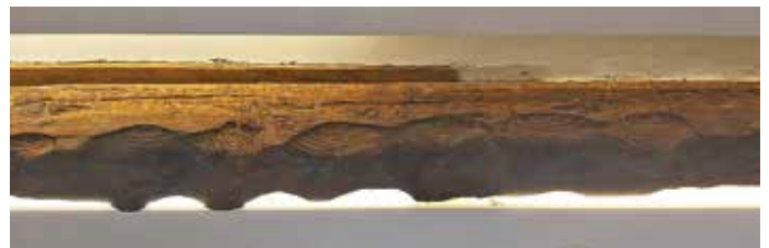
Sledi požara iz leta 1947 na ostrešju.